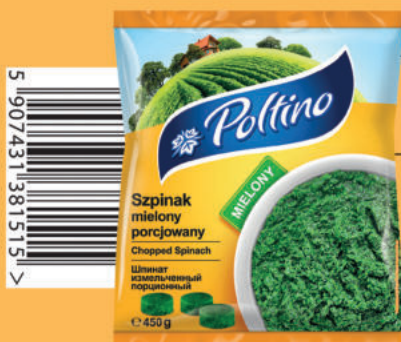
SZPINAK MIELONY PORCJOWANY