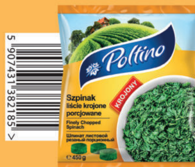
SZPINAK LIŚCIE KROJONE PORCJOWANE